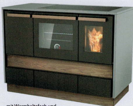
mit Warmhaltefach und Steinverkleidung (Standgerät)