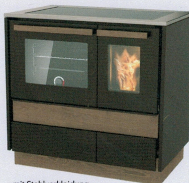
mit Stahlverkleidung, ohne Warmhaltefach (Standgerät)