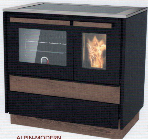
ALPIN-MODERN mit Stahlverkleidung